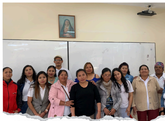
Estudiantes de sexto año de EGB