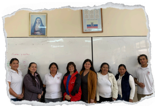
Estudiantes de séptimo año de EGB

Fondo de becas Instituto Radiofónico Fe y Alegría