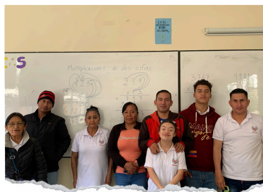
Estudiantes de cuarto año de EGB