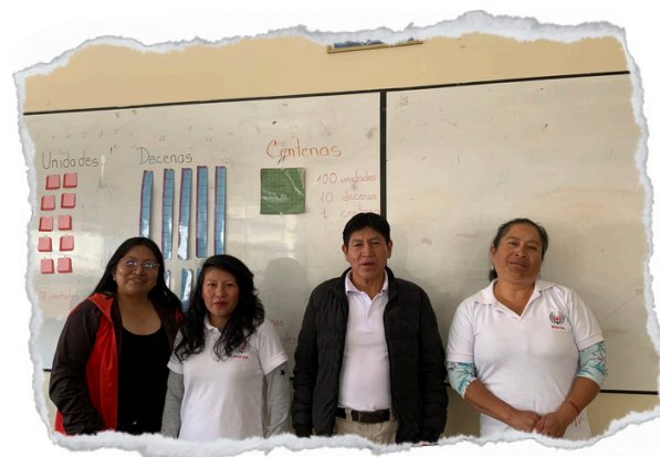
Estudiantes de primer año de EGB