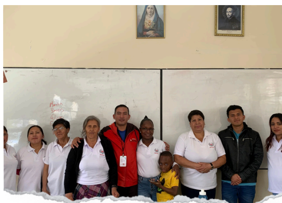
Estudiantes de quinto año de EGB