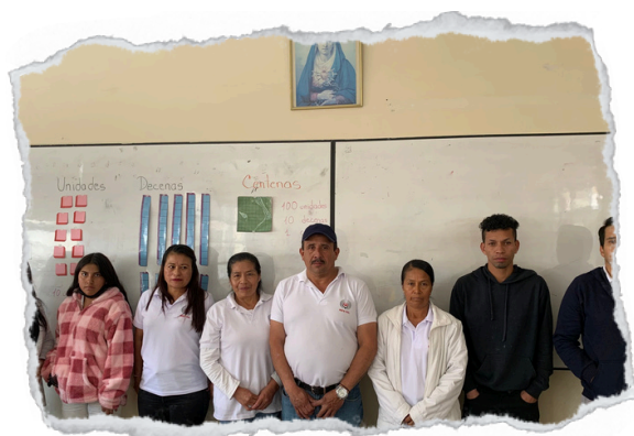
Estudiantes de segundo año de EGB